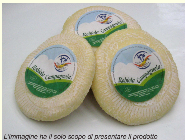
L'immagine ha il solo scopo di presentare il prodotto