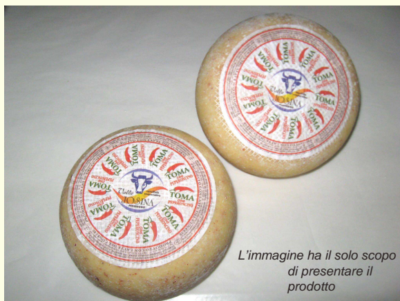
L'immagine ha il solo scopo di presentare il prodotto

Peso 1,8 – 3 Kg Diametro 15 – 20 cm Scalzo 6 – 10 cm Grasso s/s >=40%