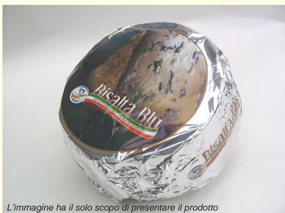
L'immagine ha il solo scopo di presentare il prodotto